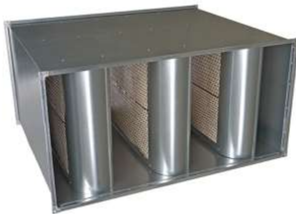
Пример панельного канального шумоглушителя прямоугольного сечения

Для снижения шума, проникающего через стенки вентиляционных каналов, а также для противодействия распространения по ним вибраций, рекомендуется выполнить монтаж вибродемпфирующих материалов на всех воздуховодах объекта. Для этого на стенки воздуховодов с внешней стороны необходимо наклеить высокоплотный эластомерный вибродемпфирующий материал по типу K-FONIK ST GK 072.