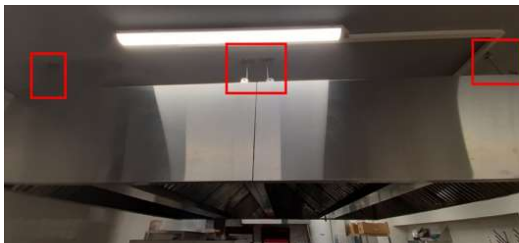
Вытяжка цеха пиццы, жестко закрепленная к плите перекрытия потолка.

В рамках акустического обследования было установлено, что инженерное оборудование и коммуникации имеют жесткие крепления, что может приводит к передаче от них шумов и вибраций на конструкции зданий и дальнейшей их ретрансляции в жилые помещения квартир. В частности, агрегаты холодильных камер и вентиляционные каналы цеха пиццы крепятся к плитам перекрытия посредством прямых подвесов.