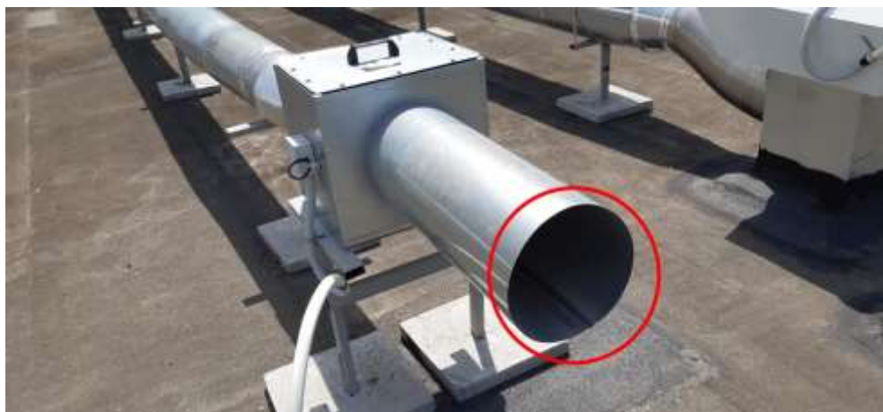
Вытяжная установка с открытым вентиляционным каналом.

октавной частоте 4000 Гц, что может доставлять дискомфорт жильцам дома. Излучение шума вытяжной установки происходит через открытый вентиляционный канал.