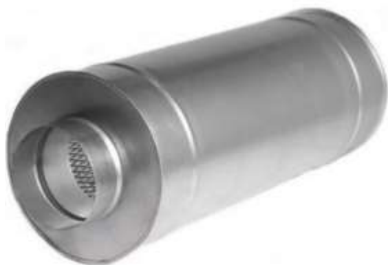
Пример канального шумоглушителя круглого сечения.